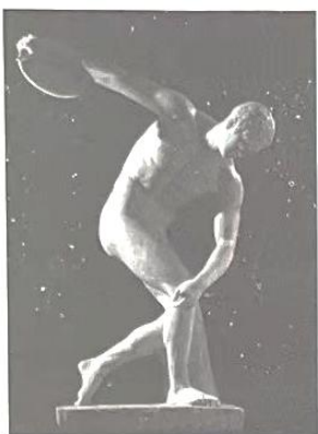
掷铁饼者 [希腊]米隆

掷铁饼是一项古老的奥林匹克项目。以掷铁饼为题材的经典雕塑作品，从艺术的视角展示奥林匹克文化，阐释和传递奥林匹克精神。