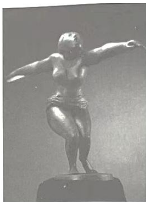
永恒的运转 [中国]李象群